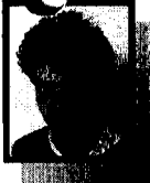
René nabewerking, algemeen